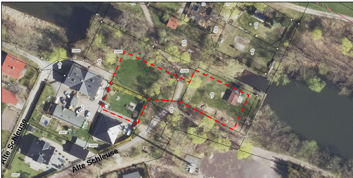
Abbildung 1: Luftbild Ergänzungsfläche – Flur 14, Gemarkung Niegripp

Die Erschließung der Ergänzungsflächen erfolgt über die vorhandene Gemeindestraße „Deichwall“, die sich südlich befindet.